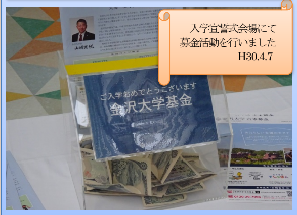
入学宣誓式会場で 募金活動を行いました H30.4.7

引き続き、金沢大学基金、修学支援基金並びに新たに創設しました課外活動振興基金へのご協力をお願いいたします。