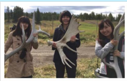
「野生動物保護区にて」 (写真右側)

私は昨年8月に、カナダの語学研修プログラムに参加しました。壮大な自然の景観に癒されながら、英語と先住民文化を学ぶという貴重な経験ができて、本当に充実した3週間を送ることができました。研修を通して、特にスピーキング・リスニング力を高めることができた実感しています。このような素晴らしい時間を過ごせたのも、奨学金の支えがあったからです。ご支援をいただいたみなさまに、感謝を申し上げます。